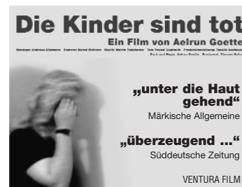
Stopper (45x35 mm)