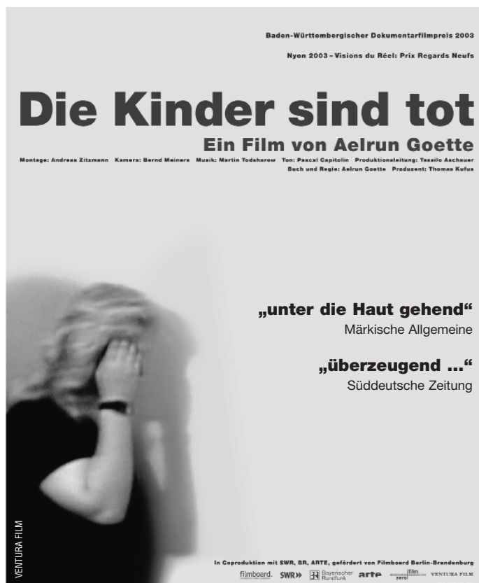
1/4 Seite (90x110 mm)