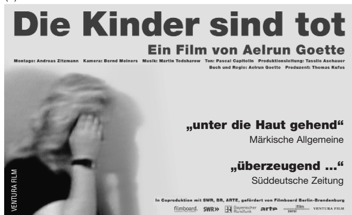
1/8 Seite (90x55 mm)