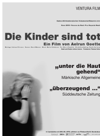
1-Spalter (45x60 mm)